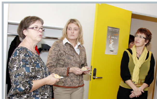
Vinderne af 2. og 3. præmien fortalte om deres idéer. Vinderen af 1. præmien kunne desværre ikke deltage, da han var i Nepal.